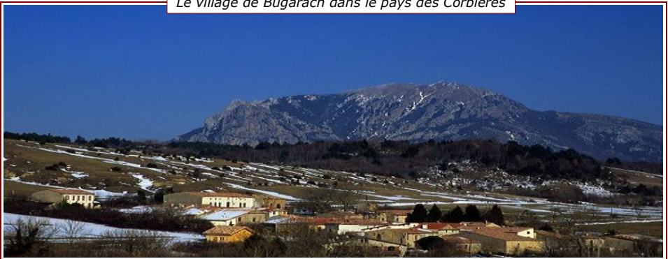
Le village de Bugarach dans le pays des Corbières

Pour se rendre compte de l'importance du phénomène, il suffit de taper « 2012 fin du monde » dans un moteur de recherche sur Internet pour obtenir, en moins d'un dixième de seconde, plus de cinq millions de pages référencées. Dans de nombreux pays, les groupes apocalyptiques associés à la mouvance du Nouvel Age enregistrent un regain d'activité et nous rappellent de terribles tra-