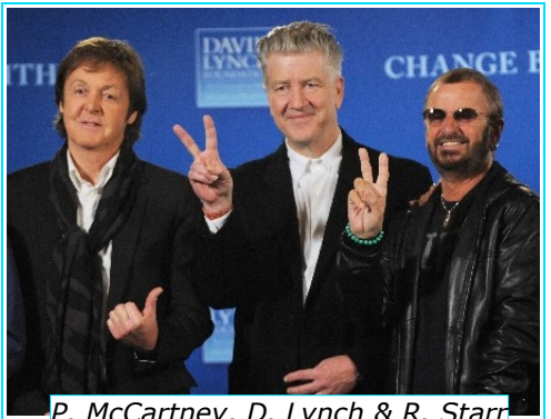
P. McCartney, D. Lynch & R. Starr

En 1955 Ron Hubbard a lancé le « projet célébrités » ( celebrity project ) en exhortant les scientologues à convertir des personnalités connues. Il avait même établi une liste de 63 noms particulièrement visés (on trouve par exemple dans cette liste Ernest Hemingway, Orson Welles, Pablo Picasso ou Walt Disney). Si aucun d'entre eux ne rejoignit l'Église, plusieurs s'y intéressèrent. C'est ainsi qu'aujourd'hui plusieurs acteurs en font partie comme John Travolta ou Nicole Kidman.