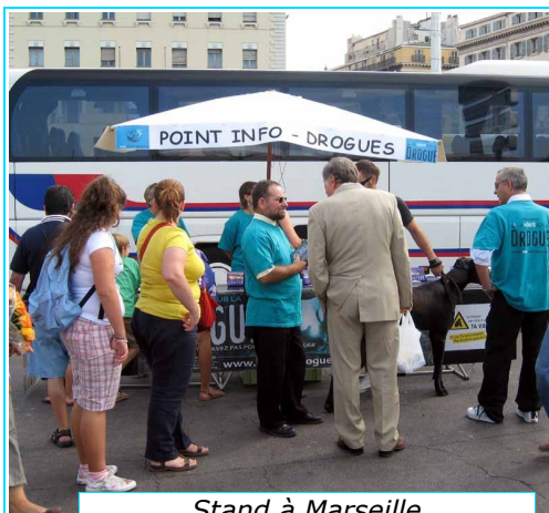
Stand à Marseille